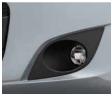
PLATA BARI (METALIZADO)