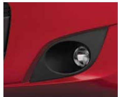
ROJO ALPINE (PASTEL)