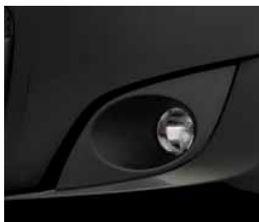
GRIS CROMO (METALIZADO)