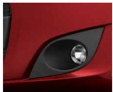
ROJO OPULENCE (METALIZADO)