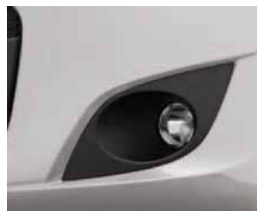
BLANCO BANCHISA (PASTEL)