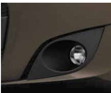
GRIS TELLURIUM (METALIZADO)