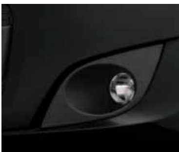
NEGRO VESUVIO (METALIZADO)